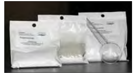
Abbildung 1: NANO BAG® mit Trägersubstanz und Messlöffel