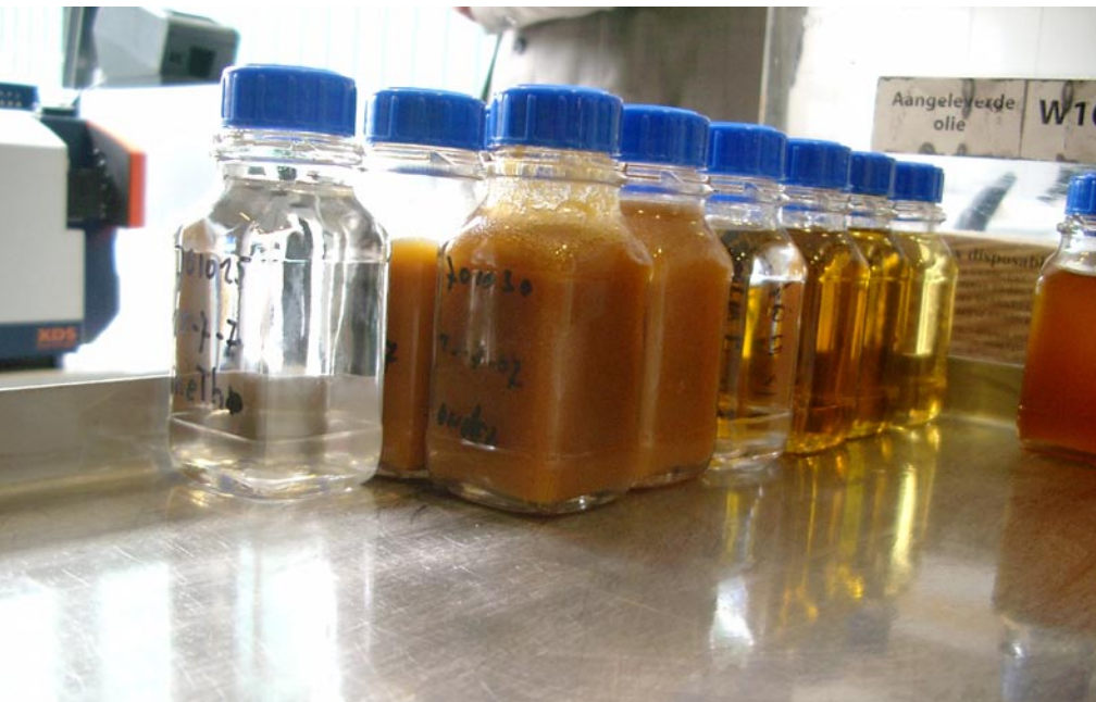
Sunoil Biodiesel produziert derzeit etwa 80 Millionen Liter Biodiesel pro Jahr